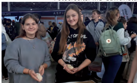
...mit fertigen Striezel