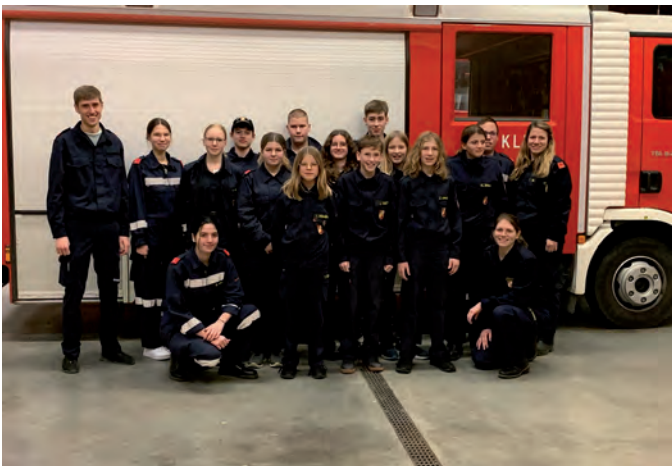
Gruppe der 12 - 15-Jährigen Feuerwehrjugendmitglieder

Neben dem Funkgerät spielen beim Fertigungsabzeichen Melder auch die verschiedenen Sirensignale eine wichtige Rolle. Die Kinder sollen diese erkennen und benennen können.