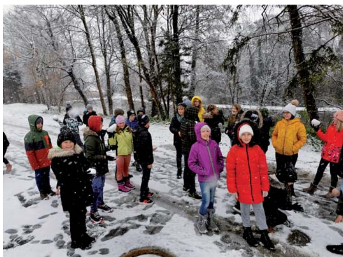
Winterwanderung / Turnunterricht im Freien :-)