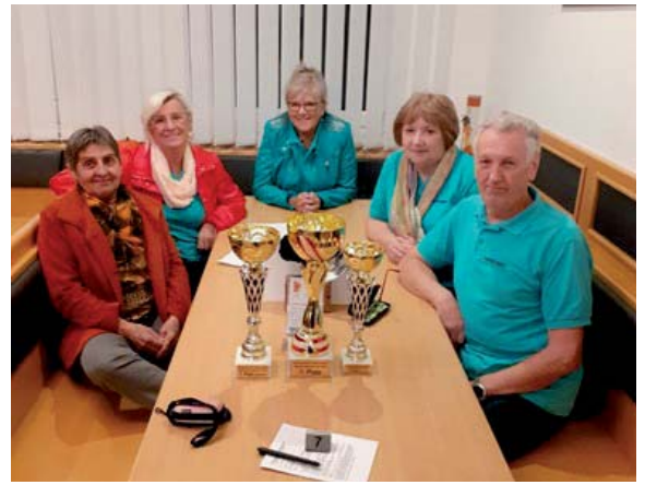
Die erfolgreiche Gruppe samt den Pokalen.

Es war für die Kegelrunde unserer Ortsgruppe ein erfolgreiches Turnier.