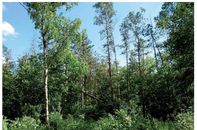
Durch Borkenkäferbefall abgestorbene Weißkiefen

Die Waldbewirtschaftung ist eine sehr langfristige Arbeit. Wir haben viele erste Schritte gesetzt und wollen auch in den nächsten Jahren aktiv sein, wo es notwendig ist.