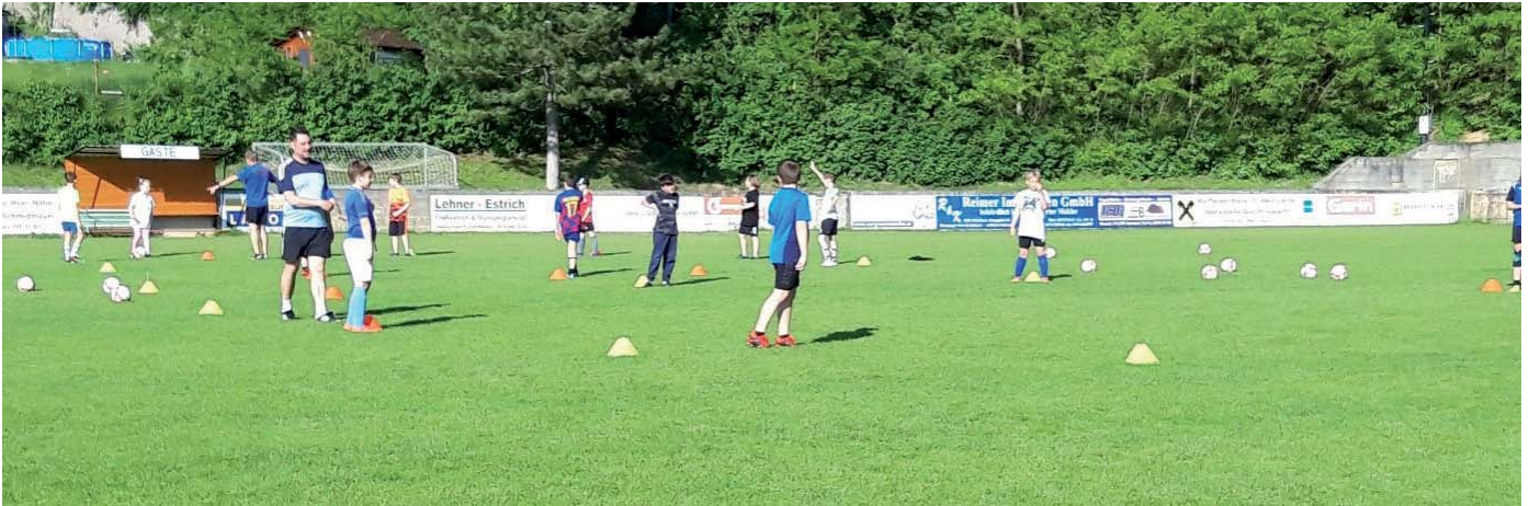
Die Kids beim Training nach der langen Corona Pause

Wenn sich Ihr Sohn/Ihre Tochter für Fußball interessiert und an einem Schnuppertraining teilnehmen möchte, kontaktieren Sie bitte unseren Jugendleiter Martin Romstorfer unter 0676 610 58 77.