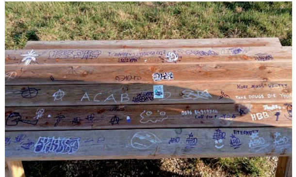
Sitzgruppe und Mistkübel beim Auffangbecken Pirawarth Kurhaus