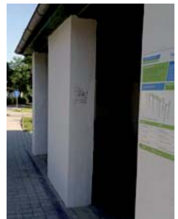
Bahnhofshaus bei der Dependance