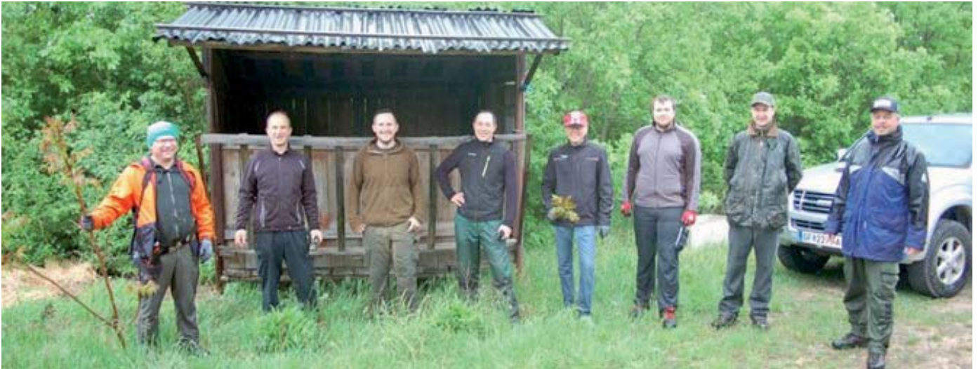
Freiwillige durchforsten den ca. 4-7 jährigen Jungbestand