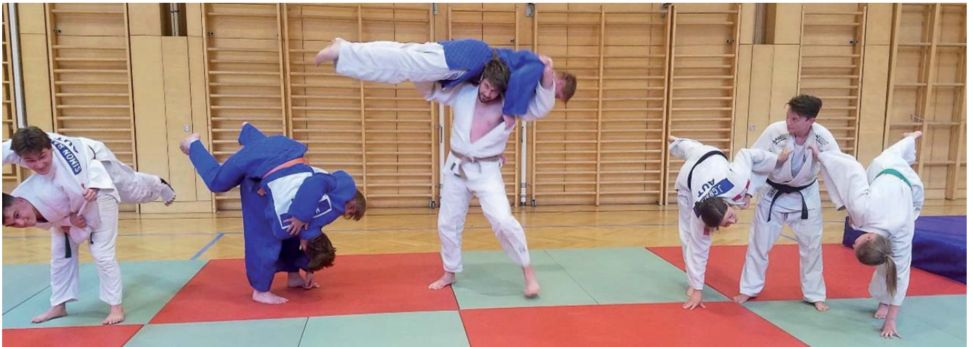
Bilder aus dem Training: Die Judoka des Union Judo Club Bad Pirawarth

2021 feiert der Union Judo Club Bad Pirawarth sein 15-Jähriges Jubiläum, das mit einer Judovorführung am Sonntag 11. Juli um 17h im Prof. Knesl Park gefeiert werden soll. Alle Interessierten aus unserer Gemeinde und Umgebung sind unter den geltenden Rahmenbedingungen herzlichst zum Zusehen eingeladen!