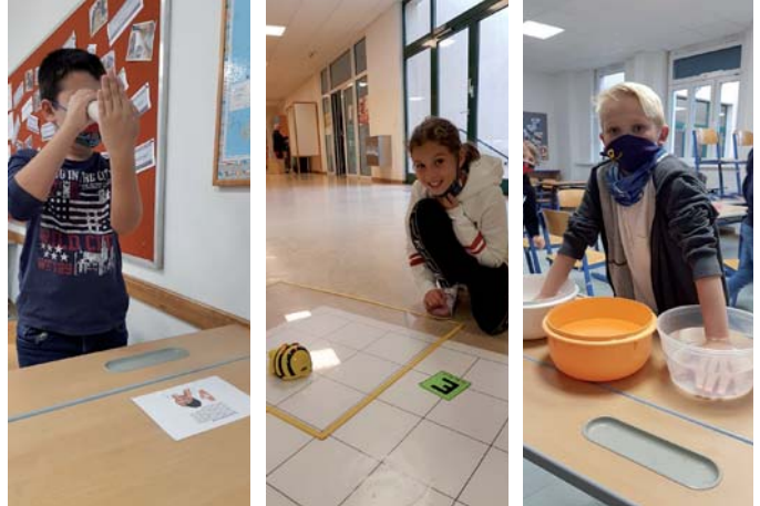
Kinder aus der 1r-Klasse beim NAWI-Projekt.

Interessens- und Begabungsförderung ist das Ziel der NAWI-Projekte. Auch die Kinder der 1. Klassen dürfen schon mitmachen. Aus den Fächern Physik, Chemie und Biologie wurden bereits Übungen angeboten, die zum selbstständigen Lernen und Entdecken anregen sollen. Im Oktober ging es um das Thema „Unsere Sinne“. Die eifrigen Teilnehmerinnen und Teilnehmer lernten dabei etwas über Geschmack, Geruch, Wärmerezeptoren und optische Täuschung. Die ersten Schritte in der Welt des Programmierens wurden mithilfe von „BeeBots“ ausprobiert.